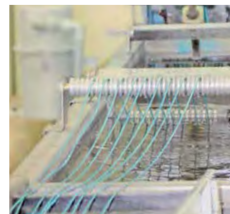
Alcuni particolari delle linee di produzione di Poliblend

L'obiettivo di raggiungere 100 milioni di euro di fatturato è stato centrato, come previsto, nel 2014, anno in cui oltre ai già citati cam-