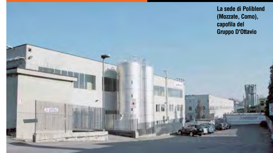
La sede di Poliblend (Mozzate, Como), capofila del Gruppo D'Ottavio

“Crescere nei mercati esteri è la condizione necessaria per continuare a fare impresa” Giancarlo D'Ottavio